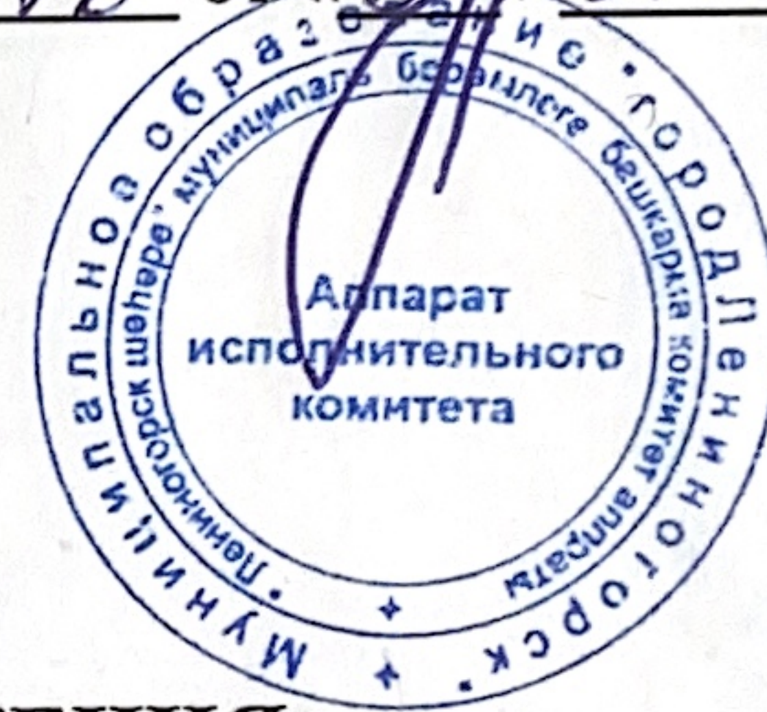
СХЕМА ТЕПЛОСНАБЖЕНИЯ МУНИЦИПАЛЬНОГО ОБРАЗОВАНИЯ «ГОРОД ЛЕНИНОГОРСК» РЕСПУБЛИКИ ТАТАРСТАН НА ПЕРИОД ДО 2033 ГОДА